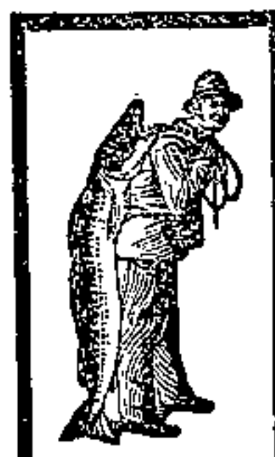
Vanto sempre emulsione con la marca "Pescatore" che distingue quella preparata dal processo Scott!

Nella cura di bambini o di adulti sofferenti di esaurimento organico il metodo di cura deve essere il più energico ed allo stesso tempo immune da ogni rischio di complicazioni. Tuttocò offre la Emulsione SCOTT, con effetto pronto e sicuro, mentre a nulla possono giovare le altre emulsioni che i medici stessi sconsigliano.