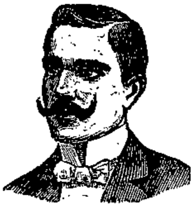
N. CASILE Riviera di Chiaia, 235 NAPOLI

La INIEZIONE CASILE guarisce i flussi bianchi, catarrhi acuti e cronici, scoli blenorragici, ulcers, leucorrea, dismenorrea, vaginiti, uretriti, endometriti, vulviti, balaniti, erosioni del collo dell'utero (piaghetta), ecc. Un flacon di Iniezione con la dovuta istruzione L. 2.50.