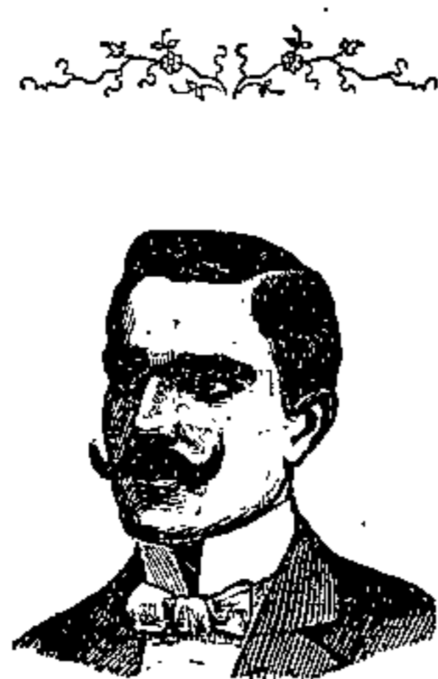
N. CASILE Riviera di Chiaia, 235 NAPOLI

La INIEZIONE CASILE guarisce i flussi bianchi, catarrhi acuti e cronici, scotti blenorragici, ulcersi, leucorrea, dismenorrea, vaginiti, uretriti, endometriti, vulviti, balaniti, erosioni del collo dell'utero (piaghetta), ecc. Un flacon d'Iniezione con la dovuta istruzione L. 2.50.