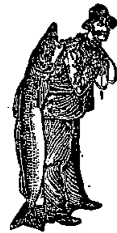
Usate sempre Emul-sione con la marca "pescatore" che distin-gue quella propria del processo SCOTT

"Raccomando alle mie gestanti e puerpere l'uso della Emulsione SCOTT, perché la ritengo il più efficace ed il meglio adattato dei ricostituenti. Anche per l'allatta-mento dei bambini, in ciò che concerne l'alimentazione e la cura della gracilità, non vi è nulla che corrisponda così bene"