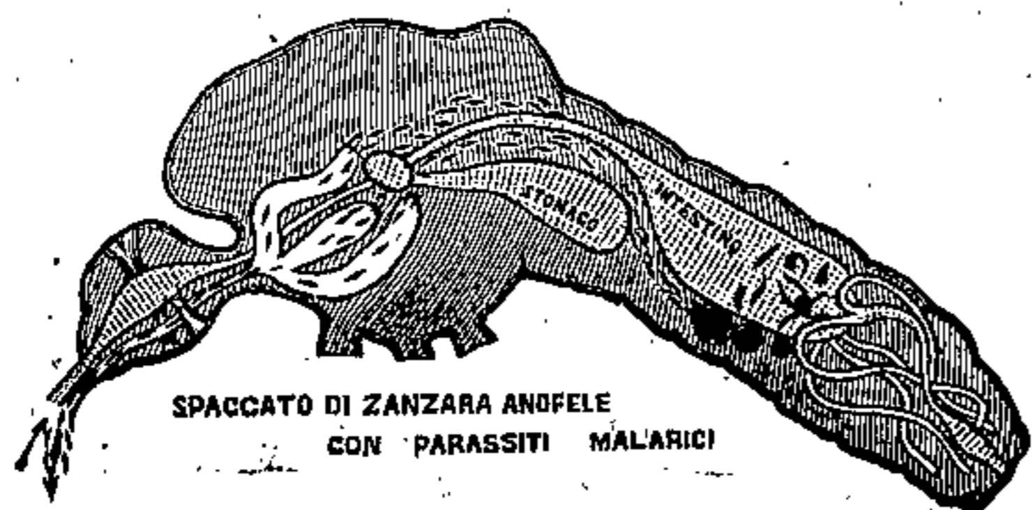
SPACCATO DI ZANZARA ANOFELE CON PARASSITI MALARICI

Rimedio sicuro contro l'infezione malarica