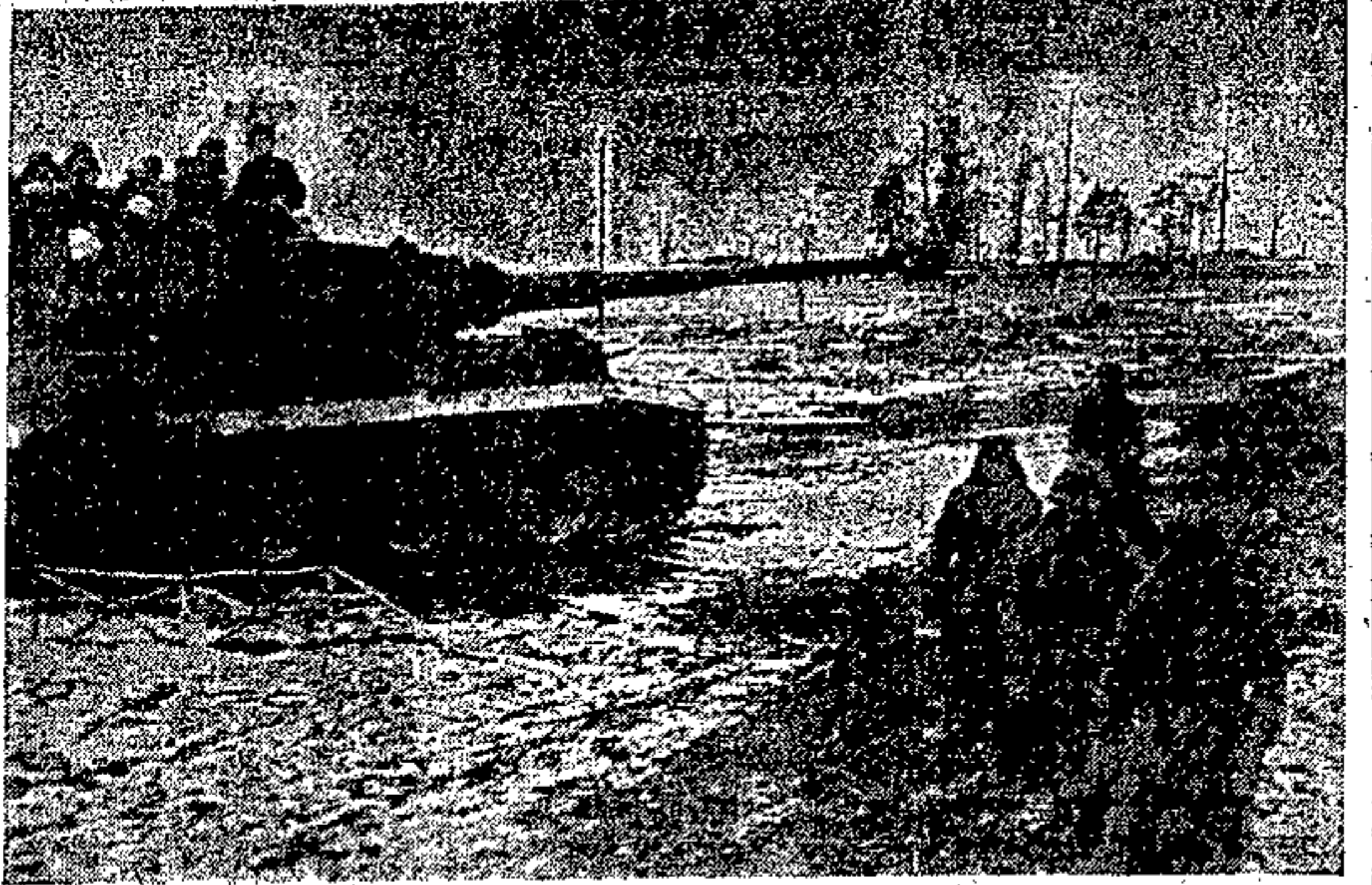
A sud di Nerev «Tigre» germanici conquistano una altura catturando i difensori bolscevici