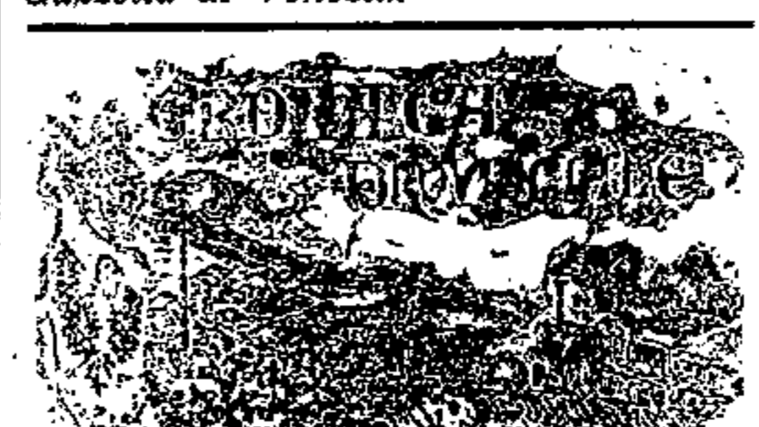
Il Collegio Convitto di Cividale.

Specialmente merita l'attenzione degli Elettori un cenno sul Marchiori che leggemo nel numero odierno della Gazzetta di Venezia .