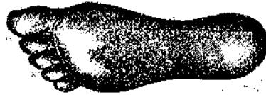
Aspetto del piede coll'uso delle suole d'Asbesto

↳ Cercansi rappresentanti nei capoluoghi di Distretto. ↳