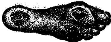
Aspetto del piede coll'uso delle suole di caotio