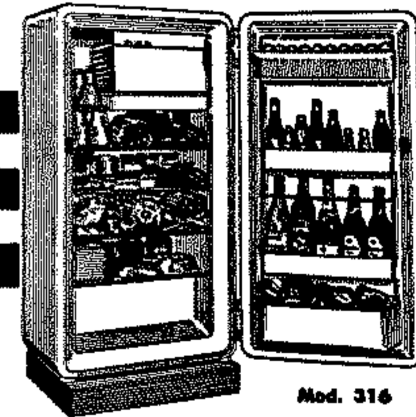
a un prezzo come questo